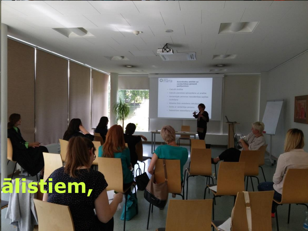
9.jūnijs, seminārs žurnālistiem, Valmiera