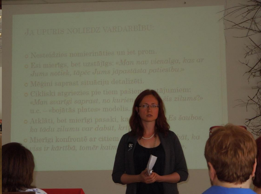
8.jūnijs – pilotprojekta ievadseminārs, Tukums