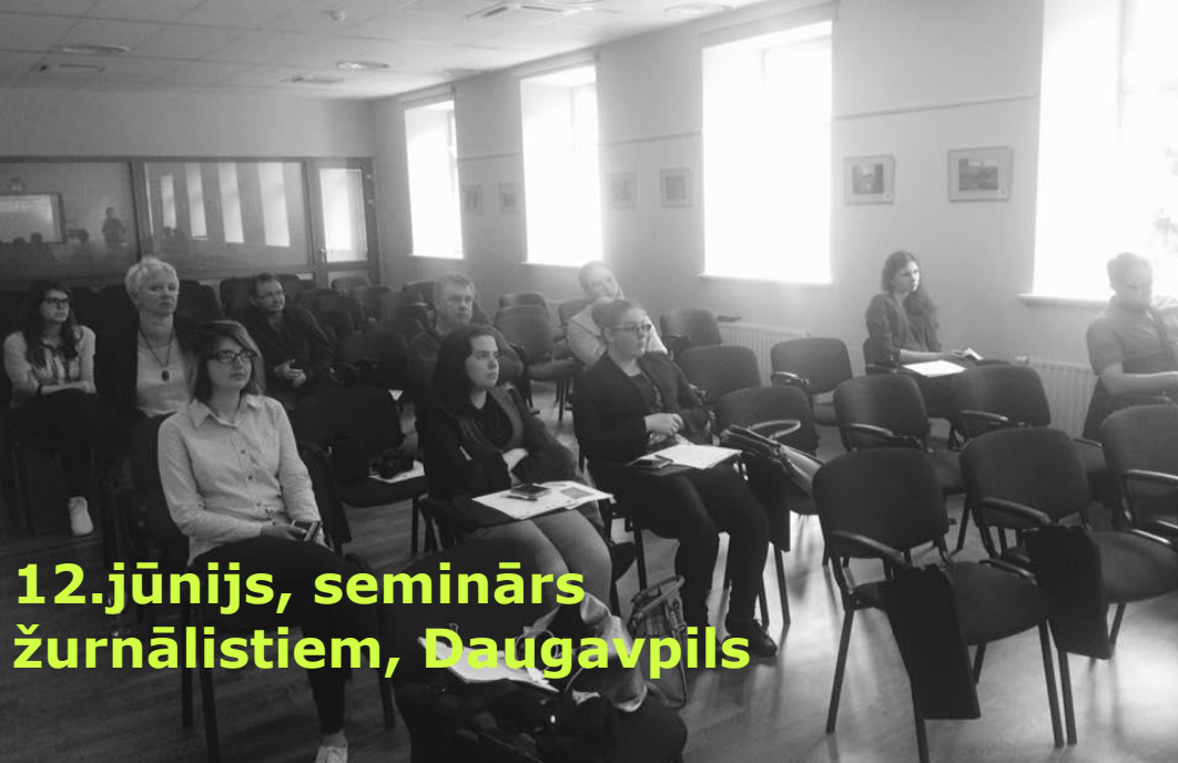
12.jūnijs, seminārs žurnālistiem, Daugavpils