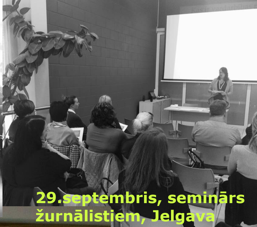
29.septembris, seminārs žurnālistiem, Jelgava