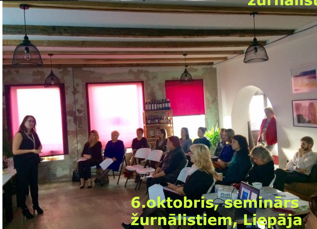
6.oktobris, seminārs žurnālistiem, Liepāja